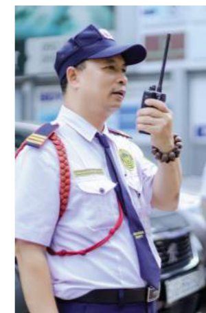
AN NINH TRẬT TỰ