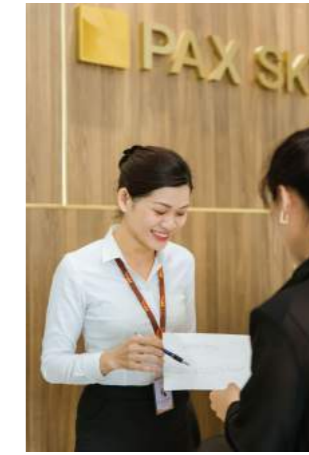
CSKH & LỄ TÂN