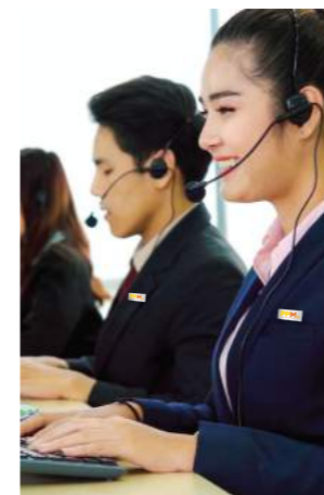
DỊCH VỤ TƯ VẤN