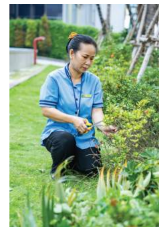
CẢNH QUAN MÔI TRƯỜNG