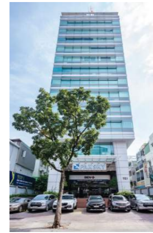
QUẢN LÝ & VẬN HÀNH