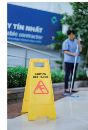
DỊCH VỤ VỆ SINH