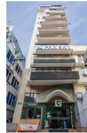
KHAI THÁC & CHO THUÊ