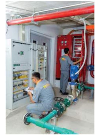
BẢO DƯỠNG - BẢO TRÌ